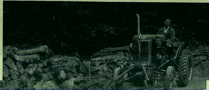
Zug von vorne